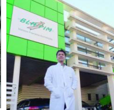
BLH Pim - Installé depuis 1993 à Saint-Vallier, BLH Pim, (intermédiaire en matières premières pour la parfumerie) s'agrandira en 2013. Coût de l'investissement : 800 000 euros.