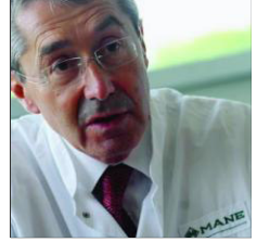
Mane & fils - Jean Mane, l'Entrepreneur français de l'année 2012, inaugurerait cette année l'extension de son unité de production à Jusine installée dans la zone d'activité de La Sarrière au Bar-sur-Loup. L'industriel projette d'investir 21,7 millions d'euros en France en 2013.